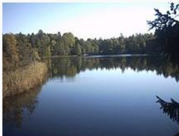
Dammsjön, september 2009